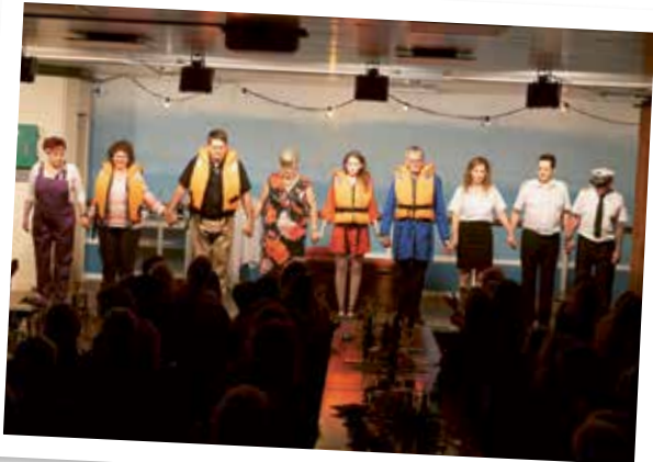
Benefiztheater „Schiff über Bord“ Représentation de théâtre «Schiff über Bord»