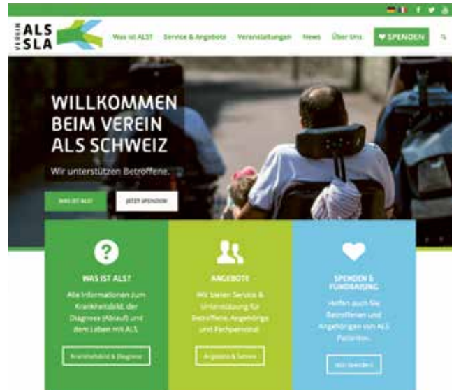
Neue Website Nouvelle site web

Vor rund fünf Jahren hat der Verein ALS Schweiz seine jetzige Website in Betrieb genommen. Mit ihrem Relaunch will der Verein im Jahr 2020 neue Akzente setzen. Die aktualisierte Website entspricht nicht nur den heutigen Anforderungen an Technik und Design, sondern geht mit einer bedienerfreundlichen Struktur und zeitgemässen Funktionalitäten auf die speziellen Bedürfnisse von ALS-Betroffenen ein. Im Vordergrund der Aktualisierungen stehen die Barrierefreiheit und Mobilität. Geplant ist zudem ein E-Newsletter.