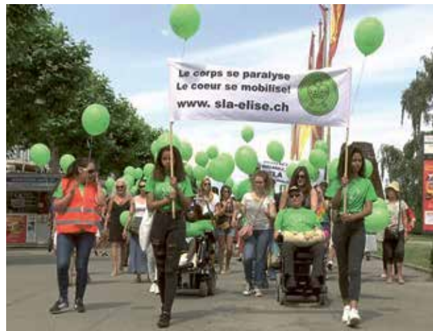
Mein Körper ist ein Gefängnis Emission 36,9 TV RTS - Mon corps est une prison

Artikel zum Herunterladen unter https://www.spitexstadtland.ch/de/aktuelles/meldungen/2019/das-neue-journal.php