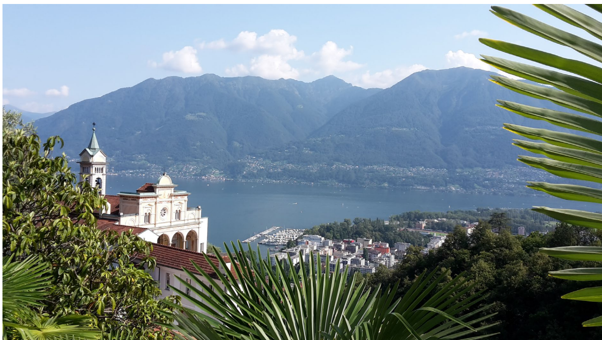
Madonna del Sasso, Blick auf Locarno